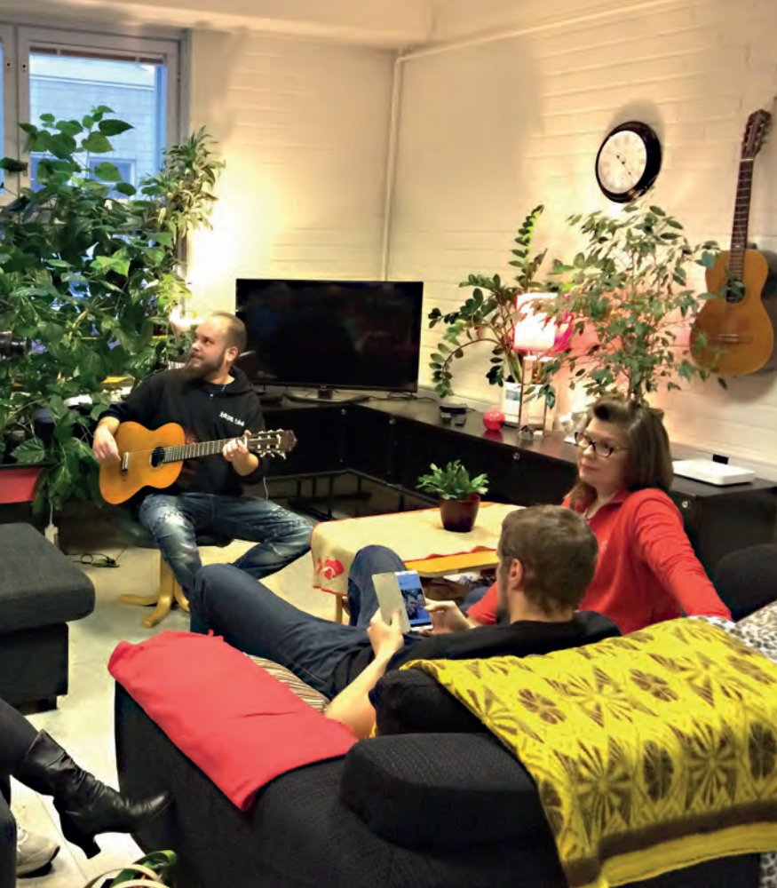
Tuumailua Malmin yhteisötilassa järjestetyissä videointitalkoissa, tammikuu 2020. Monen A-killan ja A-Kiltojen Liiton yhteistyönä syntyneitä videoita voi katsoa osoitteessa a-kiltojenliitto.fi .

Verkostoissa syntyy monenlaisia ideoita ja toisinaan järjestetään myös isompia tempauksia. Naisten Bling-iltamat on esimerkki uudenlaisesta hauskaasta verkostotyöstä. Bling veti 7.3.2020 yli kymmenen naiseryityistä tahoja ja lähes sata osallistujaa nauttimaan elävästä musiikista, teatterista, hyvinvointipalveluista ja juhlapöydästä Helsingissä. Kun jokainen teki jotakin, saatiin aikaan upea mahdollisuuksien tori.