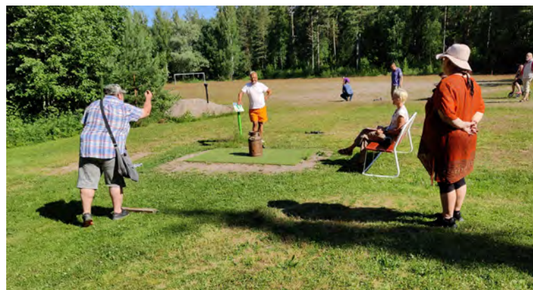
Saappaanheittokisat käytiin kesäpäivillä Imatralla.

Koronaepidemia vaikutti tapahtumiin, ja osa suunnitelluista tapahtumista ei toteutunut koronarajoitusten takia. Molemmat FC A-kilta joukkueen turnaukset peruttiin.