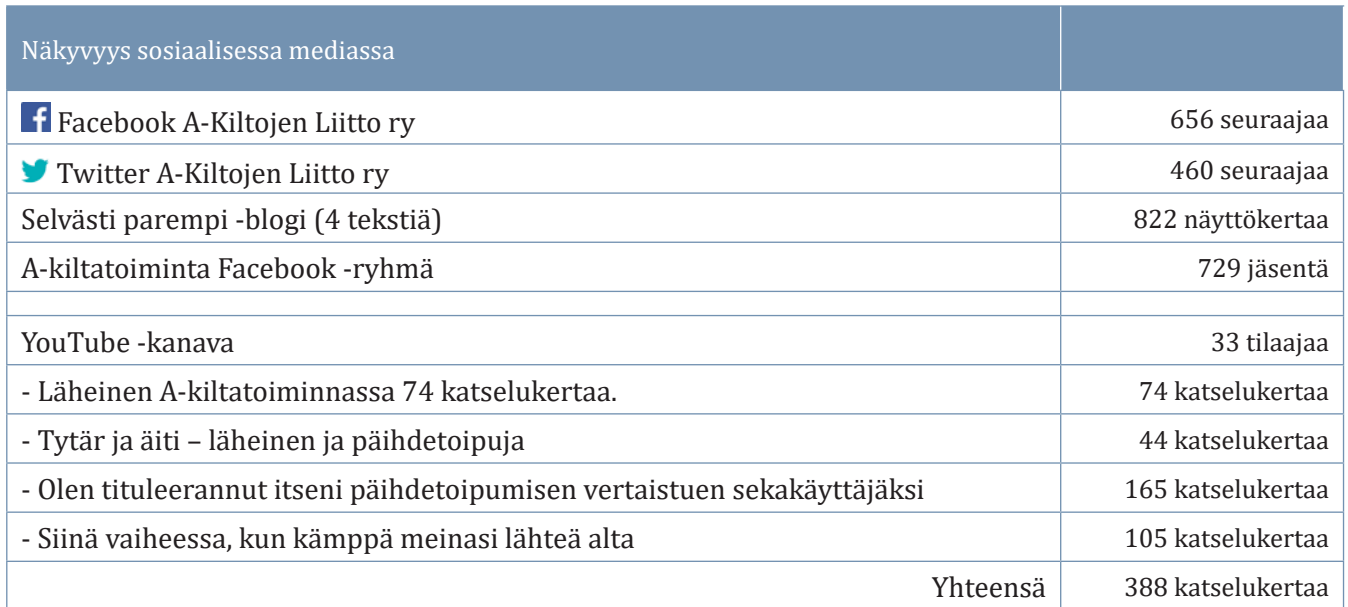
Liitetaulukko 7. A-Kiltojen Liitto ry:n verkkosivujen käyttö 2021